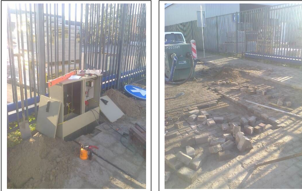
Figuur 2: Brandweerput: de besturingskast en het herstel van het straatwerk

Na het monteren van de pompen en het realiseren van de stroomaansluiting zijn de putten operationeel.